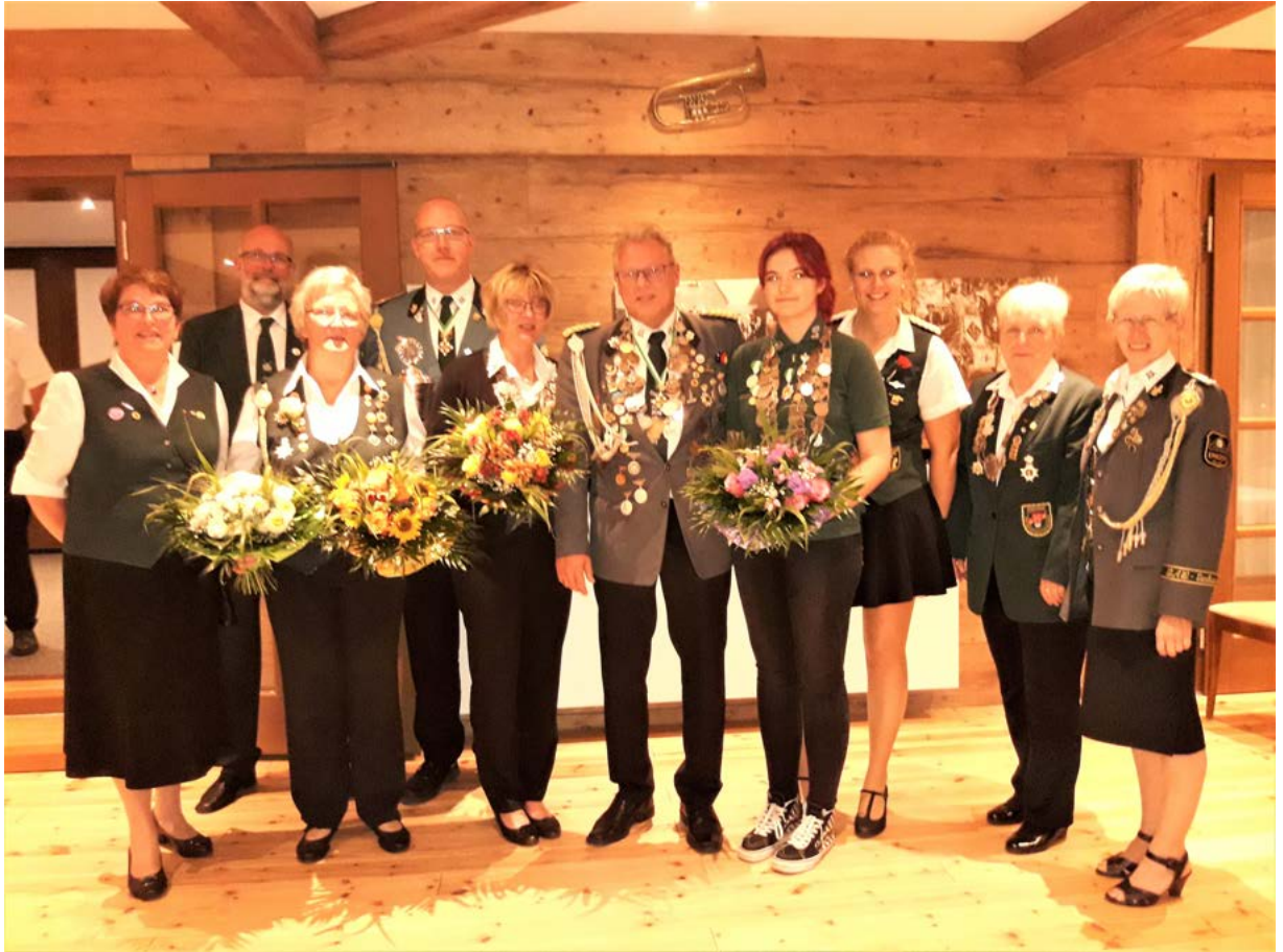
Das Königshaus über 2 Jahre

Zum KSV Fest ist zu berichten, das die Damenköniginkette verlängert worden ist.